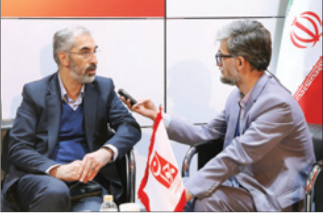
مصطفی شاه‌کرمی در گفت‌وگو با رسانه ملی ایران