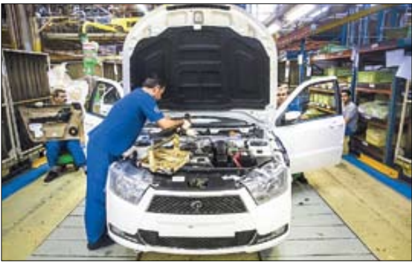
حلب، صفرنژاد مستند

«جوان» زیاده‌خواهی شرکت‌های خودروساز داخلی را بررسی می‌کند