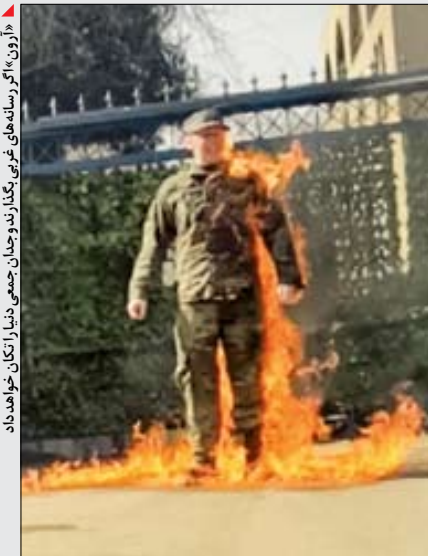
«آرون» یکی از رسانه‌های غربی، نگارنده و جلدان جسمی دنیا را تکان خواهد داد

قیمت کارخانه‌های خودرو در سال جاری در دو مرحله ۴۹ تا ۸۰ درصد گران شده، اما نه کیفیت خودروها از تقا یافته و نه مصرف سوخت‌شان بهینه شده است، با این حال خودروسازان همچنان زیان‌ده هستند و مشکل نقدینگی دارند. بازار انحصاری نیروی کار و انرژی ارزان در اختیارشان است اما مدام گلابه و شکایت می‌کنند و به بهانه قیمت‌گذاری دستوری در خواست‌های‌شان را به کرسی می‌نشانند. اخیراً نام‌های از سوی مدیر عامل ایران خودرو خطاب به سازمان بورس رسانه‌ای شده که با حربه زیان‌دهی و سرکوب قیمت از سوی دولت، از افزایش قیمت