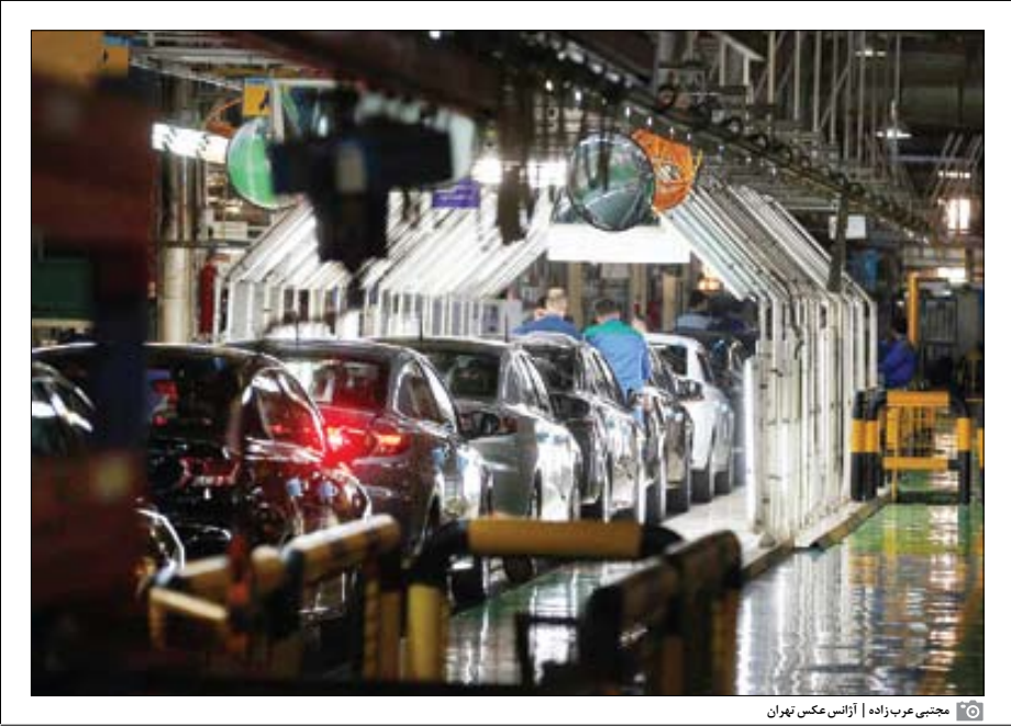
محنتی ورع‌راه | ازتس مکن تهران

«جوان» زیاده‌خواهی شرکت‌های خودروساز داخلی را بررسی می‌کند