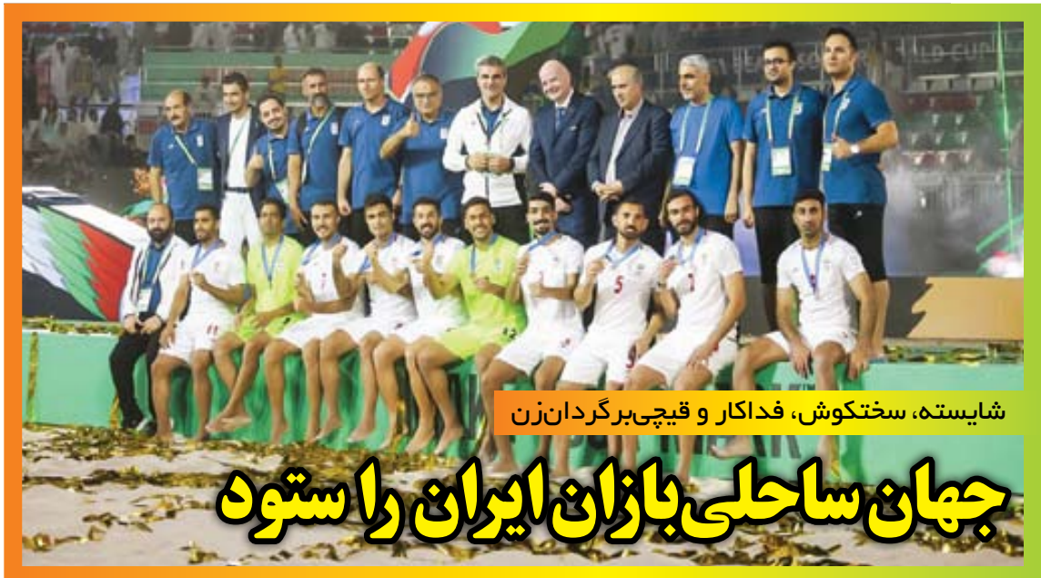
شایسته، سنگکوش، فداکار و قیچی برگردان زن