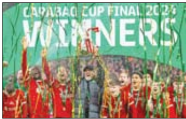
لیورپول دهمین قهرمانی جام اتحادیه را جشن گرفت