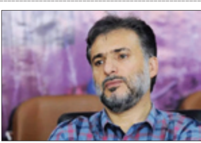
سیدجواد هاشمی خبر داد

وزیر فرهنگ و ارشاد اسلامی از تمدید زمان بیست‌وپه‌مین نمایشگاه رسانه‌های ایران خبر داد. محمد مهدی اسماعیلی در حاشیه جلسه هیئت دولت با اعلام خبر تمدید «نمایشگاه رسانه‌های ایران» عنوان کرد: با همکاری دوستان در بخش‌های مختلف از جمله وزارت کشور، زمان برگزاری نمایشگاه «رسانه‌های ایران» به دلیل استقبال درخورتوجه مردم و اصحاب رسانه تا بعدازظهر امروز پنج‌شنبه (۳ اسفندماه) تمدید شد.