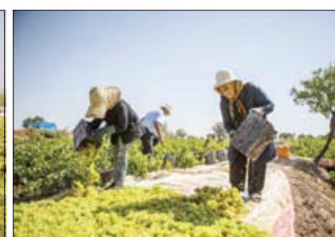
تعریف دوباره «اقتصاد مقاومتی» با حضور بانوان در عرصه تولید