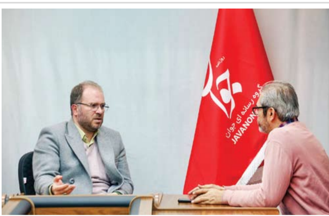
پاورقی و سیدخندان

پاورقی طنز است. سیدخندان طنز و سرگرمی است. من برنامه‌ای که سرگرمی صرف باشد، نمی‌سازم. نه اینکه نمی‌توانم، فکر می‌کنم نسبت به وقت مخاطب تعهد دارم و دارم از بودجه عمومی، یعنی جیب همین مخاطب مایه می‌گذارم و باید نسبت به جامعه‌ای که روی یکسری بنیان‌های فرهنگی استوار شده است، تعهد داشته باشم، و گر نه اگر فقط قرار باشد به پول فکر کنم، راه‌های خیلی ساده‌تر و کم‌دردسرت‌تر می‌وجود دارد که اتفاقاً برخی مدیران هم همین را بیشتر می‌پسندند. نکته دیگر اینکه ما در ادبیات، طنز و شعر ظرفیت‌های زیادی برای سرگرمی داریم اما از آنها به درستی استفاده نکرده‌ایم. اتفاقاً سرگرمی اینجا