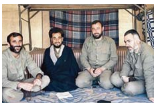
شهید رحیمیان نفر اول سمت چپ

گفت‌وگوی «جوان» با برادر شهید جهادگر مسعود رحیمیان که در عملیات والفجر ۸ آسمانی شد