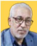
دودعامری کارشناس سیاسی

مگر بر اساس آنچه قانون معین می‌کند، نکته مهم این است که اعمال این حق به اندازه‌های مهم و سرنوشت‌ساز در زندگی جامعه است که برای انتخاب کنندگان و انتخاب شوندگان، یک تکلیف درونی ایجاد می‌کند. به عبارت دیگر، حق انتخاب، برس‌نوشت یک ملت را دچار تغییرات اساسی می‌کند، لذا در اعمال این حق، تکلیف انتخاب‌بهترین‌ها برای هر فردی یک تکلیف وجدانی است، چراکه عدم اعمال درست این حق، تأثیر مستقیم در سرنوشت