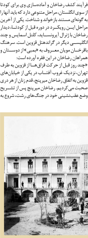
نمای کلی گراند هتل قزوین

■ کودتایی برای تثبیت استعمار انگلیس در ایران