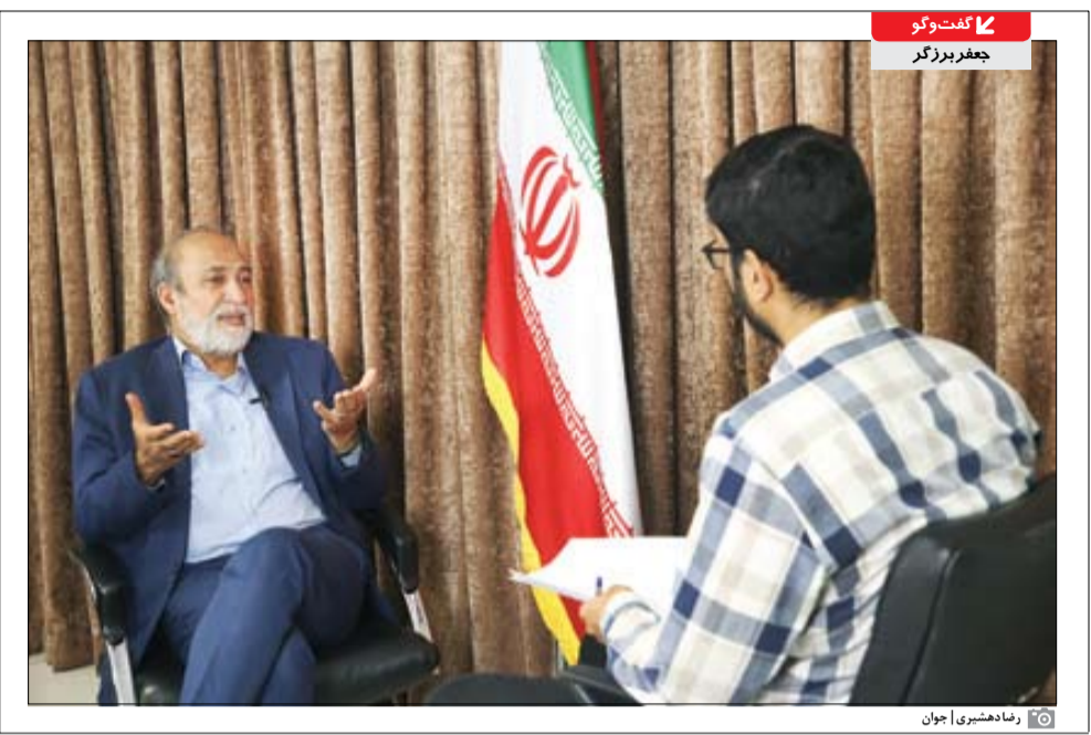
رماندهشیری | جوان

شورای نگهبان تازه آسامی نهایی را اعلام کرده است، اما با وجود این نظرسنجی‌ها نشان می‌دهد نسبت به گذشته وضع بهتر شده و میزان مشارکت چند درصدی افزایش پیدا کرده است. هنوز فرصت خوبی هم تا انتخابات داریم و همیشه ۱۰ روز آخر انتخابات تبلیغات شروع می‌شود و فضای انتخابات در کشور قدرت می‌گیرد، یعنی در ۱۰ روز آخر بین ۲۰ تا ۳۰ درصد به میزان مشارکت در آن مقطع افزوده می‌شود. نکته دیگری که در مورد انتخابات مجلس باید مورد توجه قرار گیرد، این است که انتخابات مجلس در مناطق مختلف کشور برای مردم انگیزه‌های مختلفی تولید می‌کند و برای این انتخابات مهم است، مخصوصاً در حوزه‌های انتخاباتی تک‌نفره یا دوفنره اگر نماینده بتواند کارآمد باشد، تأثیر زیادی در فضای انتخابیه خود می‌گذارد. وظیفه نظارت بر مجریان هم بر عهده مجلس است. نماینده به وزرا را می‌اعتماد می‌دهد و وزرا باید در مقابل نمایندگان پاسخگو باشند، بنابراین