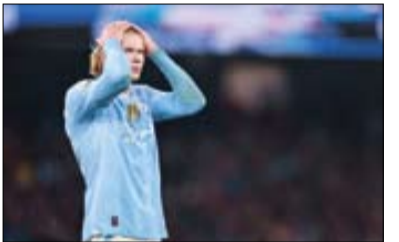
واکنش پپ به سقوط سیتی