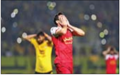
پنجره نقل وانتقالات در سپریلیس همچنان بسته است