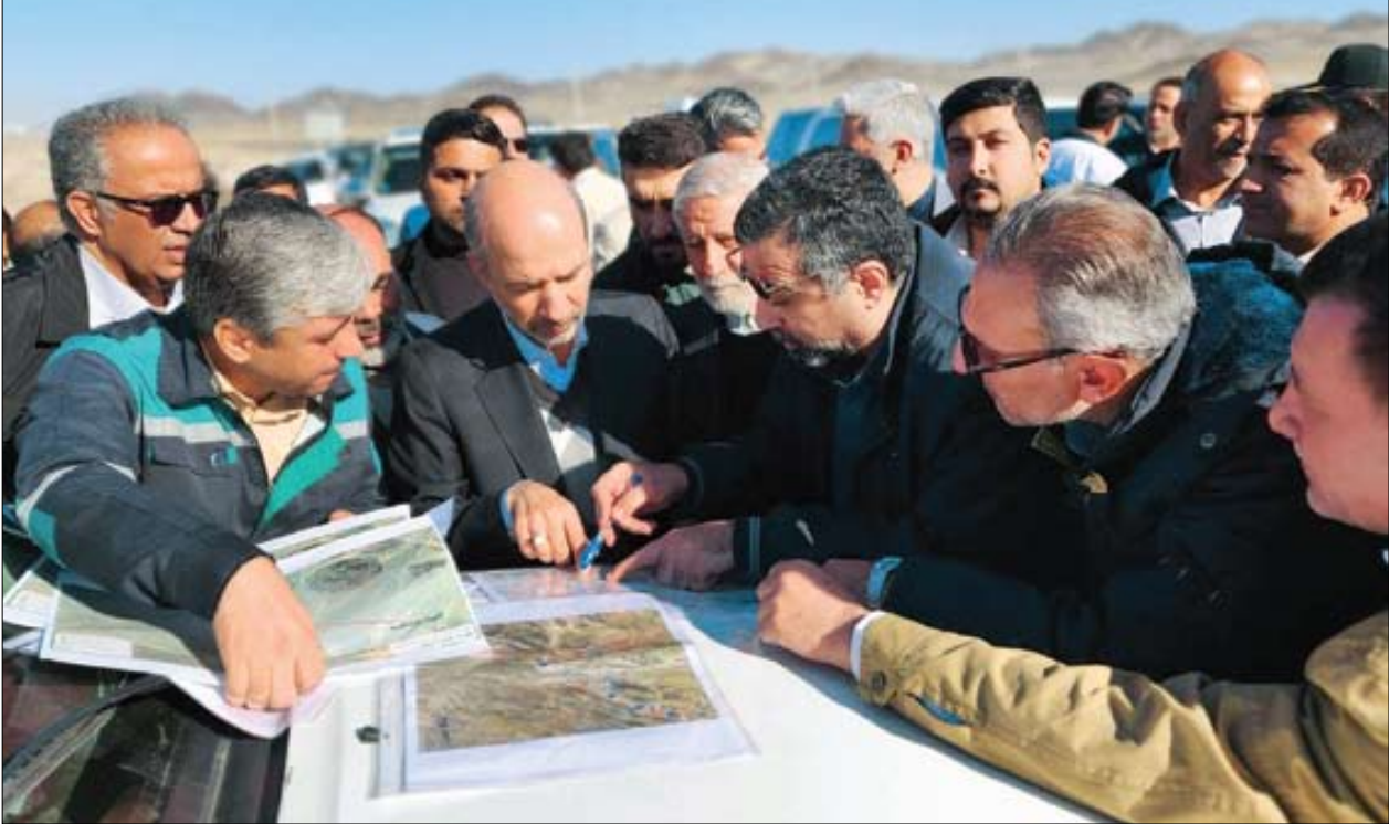
وزیر نیرو در بازدید از مراحل اجرایی بزرگ‌ترین آب‌شیرین‌کن خشکی جهان، روند آن را بر شتاب و رضایت‌بخش توصیف کرد

در سالروز ولادت حضرت عباس علیه‌السلام و روز جانباز انجام شد