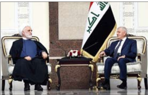
از‌های در سفر به عراق با عبداللطیف رشید، رئیس‌جمهور این کشور نیز دیدار کرد

همه‌جانبه خود در حوزه‌های مختلف، توسعه و تعمیق بخشند. رئیس‌علیه با تبیین و تشریح اهمیت مقوله «امنیت» برای هر دو کشور ایران و عراق، گفت: ضروری است همکاری‌های دو جانبه ایران و عراق حصول محور مقولات امنیتی در راستای تثبیت و تحکیم امنیت دو کشور، گسترش یابد و توافقنامه‌های امنیتی منعقد می‌ماند، هر دو طرف، به صورت تمام و کمال اجرایی شوند.