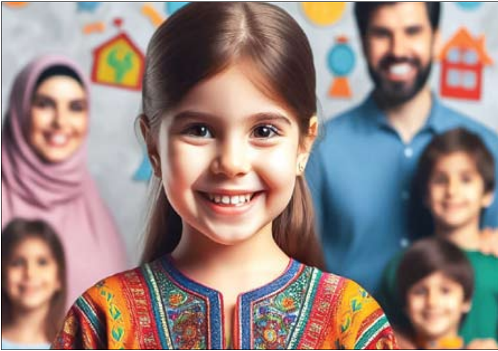
تغییر مبانی فکری خانواده‌ها لازم و ضروری است

وی در آخر گفت: «تهوایه همان عقده‌های دوران کودکی است. مثلاً فردی که در خانواده پرجمعیتی زندگی و تحصیل کرده است، گلابه می‌کند که چرا به همه نیازهایش پاسخ داده نشده است، بنابراین این فرد در زندگی شخصی‌اش معتقد است باید فرزند کمتر داشت تا بتوان به نیازهای او پاسخ داد. این همان پایه‌های فکری است که باید به ریمخت و از نوساخت.»