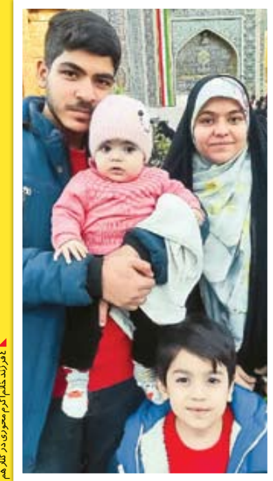
۴ فرزند ختم‌خیزی در کنار هم

«فرزانی که تصمیم دارند به تعداد فرزندان خود اضافه کنند، سعی کنید فاصله سنی سه تا چهار سال بیشتر نرسود چون هر چه بیشتر شود هم بچه‌ها و هم والدین بیشتر اذیت می‌شوند. وقتی بچه‌ها در سن نوجوانی باشد با توجه به تغییر خلقیات و شرایط رده سنی، قدرت پذیرش کمتری نسبت به بچه کوچک‌تر دارند. الان پسر چهار ساله من با دختر هفت ماهه‌ام راحت‌تر کنار آمده و همبازی شدند اما دختر ۱۳ ساله‌ام با اینکه خواهرش را خیلی دوست دارد ولی برخی مواقع اصلاً با او کنار نمی‌آید. سر و کله زدن با بچه‌ها همین‌طور که شیرین است سخت هم هست. باید تمرین صوری کرد. مشغله‌های زن خانه‌دار به شدت زیاد است، از تروتمیز کردن خانه گرفته تا رسیدگی به سایر امورات و بخت و پز و حالا هر چه تعداد بچه‌ها بیشتر باشد این سختی‌ها بیشتر می‌گردد. متأسفانه بعضاً بچه‌ها هر کدام ساز خود را می‌زنند و هر کدام متفاوت از دیگری است. حتی بچه شیرواز هم ساز مخصوص به خود را دارد. در کنار همه این‌ها نیازهای همسر نیز وجود دارد. بر همین اساس خانم‌ها توجه داشته باشند که تعدد فرزند تمرین صبر است اما در عین حال به شما کمک می‌کند در گیر حاشیه‌های زندگی نباشید و به این باور برسید که همسر و فرزند، همسرداری و بچه‌داری اصل زندگی است.»