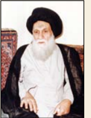
۱۳۵۸. آیت‌الله‌العظمی سید عبدالله موسوی شیرازی

از موقعیت ویژه‌ای برخوردار هستند. در نتیجه گذشته از نقش امام خمینی رهبری انقلاب، بررسی تأثیرگذاری این شخصیت‌ها در روند تحولات انقلاب، اهمیت به سزایی دارد. آیت‌الله العظمی سیدعبدالله موسوی شیرازی از جمله شخصیت‌های مبارزی است که چندین دهه علیه سیاست و مملکت رژیم پهلوی به مبارزه پرداخت و در جریان کشف حجاب و اعتراض