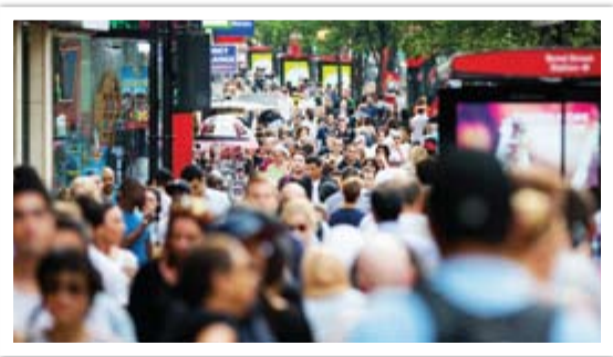
تلاش برای تضعیف بنیان خانواده

شخصیت‌های اصلی داستان‌ها به ۱۲ درصد رساند. این خیر را مؤسسه تحقیقاتی رسانه «گلااد» (GLAAD) که به مدت ۳۶سال شخصیت‌های لزبین، همجنس‌گرا، دوجنس‌گرا، ترنس‌ها و دگرباشان را بررسی کرده است، بر اساس هفدهمین نسخه مطالعه خود اعلام کرد. این گزارش که سریال‌ها و برنامه‌های پر بیننده شبکه‌های ABC، CBS، The CW، FOX و NBC را در سال‌های ۲۰۲۱ و ۲۰۲۲ بررسی کرد، کاراکتر دگرباش جنسی دارند که یعنی این رقم با افزایش ۲۸/۸ درصدی نسبت به سال قبل، رکورد زده است. طبق این گزارش اکثر شخصیت‌های دگرباش در این سریال‌ها یا بر تنامد، در ضمن برای همجنس‌گرایان در دنیاست