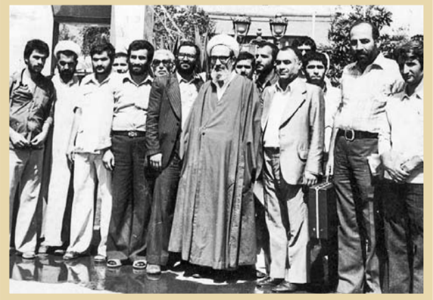
در هفته‌های ۱۳۵۸. آیت‌الله محمدرضا مهدوی کنی رئیس کمیته انقلاب اسلامی

کمیته‌های انقلاب اسلامی در دوران فعالیت خویش به الگویی تاریخی و ماندگار از سلامت و خلوص نیروهای وفادار به نظام اسلامی تبدیل شدند. آنان با تلاش مستمر و بی‌چشمداشت خویش، توانستند در مقطعی مهم و حساس اعتماد مردم را جلب کنند و محل مراجعه ساکنان هر محله شوند. تجربه کمیته‌ها نشان داد که جماعتی مؤمن و پرانگیزه می‌توانند دستاوردهای مهم و تاریخی داشته باشند.