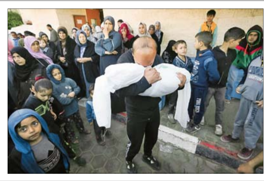
یک کودک فلسطینی در حال فرار از نوار غزه.

امریکا، اروپا و غرب در سکوت سران عرب سلاخی کودکان و آوارگان رفح را آغاز کردند. ۵۰ بمباران در یک روز و ۱۰۰ کشته