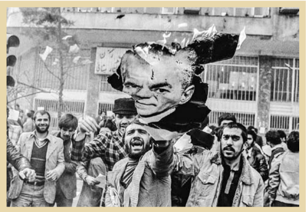
▼۲۷ دی ۱۳۵۷، فضای آزادشاهیه عمومی در پی فرار محمدرضا پهلوی از ایران

■ آنان که رفتن شاه را تجویز نمی کردند همانگونه که اشارت رفت، گذشته از اکثریت قاطع ملت ایران سران دولت‌های اروپایی و نیز رئیس‌جمهور آمریکا و سفیر این کشور در تهران که طرفدار خروج شاه از کشور بودند، معدودی نیز با این امر مخالفت می‌کردند. سران ارتش و کارکنان ساواک، در عداد