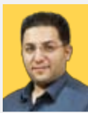
وجدعظیمینا دبیر گروه اقتصاد

پرداخت تسهیلات از سوی بانک‌ها محرک نقدینگی به‌شمار می‌رود و در صورت مدیریت مؤثر، افزایش نقدینگی می‌تواند منجر به رشد اقتصادی شود، در غیر این صورت، رکود تورم را در پی خواهد