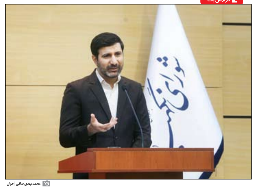
محمد مهدی مژدایی، اچوان

■ عدم حرازاها در مرحله شورای نگهبان کاهش می‌یابد سخنگوی شورای نگهبان در برباره اظهارات اخیر وزیر کشور مبنی بر عدم فرصت کافی برای بررسی صلاحیت ۳۰درصد نامزدهای شرکت در انتخابات مجلس گفت: صحبت‌های وزیر کشور در خصوص هیئت‌های اجرائی بود و ارتباطی با شورای نگهبان نداشت. ما در چارچوب مشخص‌شده در ماده ۱۱۰ قانون انتخابات موافقت کرد. گفتنی است وزارت کشور اخیراً پیشنهادات خود در برگزاری انتخابات الکترونیک در برخی حوزه‌ها را به شورای نگهبان ارائه کرده بود. موافقت شورای نگهبان با برگزاری انتخابات الکترونیک در چارچوب مشخص‌شده در ماده ۱۱۰ قانون انتخابات مجلس شورای اسلامی است.