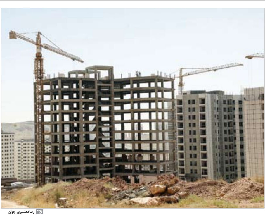
رماندهسبوری | جوان

دولت با کاهش قدرت تسهیلات‌دهی بانک‌های متخلف خصوصی، اعتبارات را به سمت ساخت و ساز مسکن هدایت کند