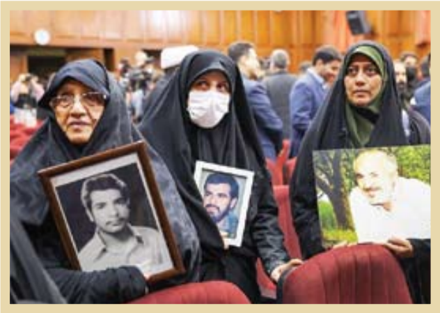
۱۳۶۱،۲۰۲۰، زمانی از دادگاه منافقین

قطعا ریشه اقدامات منافقین، به آموزه‌ها و ایدئولوژی آنها مرتبط است. سازمان منافقین اساساً کارش را با مطالعات وسیع در حوزه‌های مختلف اجتماعی و عقیدتی شروع کرد. پس از حدود دهه که در این زمینه بررسی‌هایی داشتند، نهایتاً به این نتیجه رسیدند به جای مبارزه با رژیم شاه به عنوان یکی از دست‌نشان‌گان امپریالیسم امریکا در منطقه خاورمیانه، در حقیقت باید مبارزه با