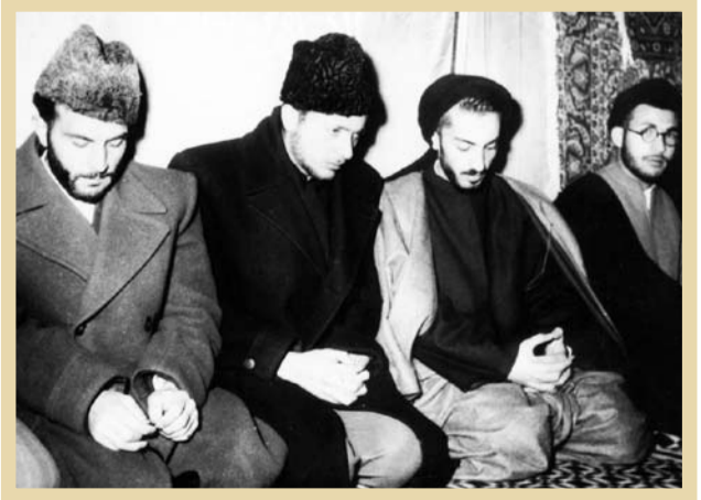
نواب صفوی، امیر عبدالله کر اسحاق و شهید خلیل طهماسبی (پس از ۱۳۳۱ از راست: جیتااسلام سیدمحمدعلی لولاسی، شهید مصدق)

«یکی از چیزهایی که در تاریخ معاصر ما متأسفانه به کلی به دست فراموشی سپرده شده، همین است که تأثیر جریان مرحوم نواب و حضور نواب را در روی کار آمدن حکومت ملی دکتر مصدق کاملاً نادیده گرفته است. این را بدانند که اگر مرحوم نواب بود و تلاش‌های او و یارانش نبود و از عالی که آنها در محیط جو هیئت حاکمه یعنی دستگاه سلطنت، به‌وجود آورده بودند کرد و بعد هم یکی از یاران ایشان کسروی را کشت، یعنی از طرف نواب دو مرتبه کسروی مورد حرک ت به اصطلاح نظامی قرار گرفت. یکبار به وسیله خود ایشان که با کار د حمله کرد، یکبار به وسیله مرحوم امامی، سیدحسین امامی که با اسلحه زد و کسروی را عمالاً نود کرد. کار سیاسی هم بود، همانطور که قبلاً هم گفته‌ام اسلام‌امهیت حرکت ضد دینی که کسروی هم یکی از تئوریسین‌ها و طرفداران بود یک ماهیت سیاسی بود. هیچ‌کس نمی‌تواند بگوید کسروی یک عنصر غیرسیاسی بوده، مگر کسی می‌تواند چنین چیزی را بگوید؟ خود کسروی یک عنصری بود که اصلاً حرکش از آغاز چه در مشروطیت و چه بعد از مشروطیت تا