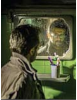
نگاهی به «تورویسم» در آیین ۲ فیلم سینمایی «هناس» و «ضد»