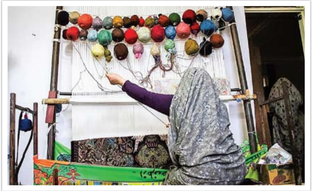
تعمیرات کانون فرهنگی

خود را در برنامه‌ای که از سوی کانون فرهنگی - هنری طراحی و روی گوشی اعضا نصب شده است، ثبت می‌کند و پس از تکمیل تعهدنامه و ارائه ضمانت که ضامن نیز دو نفر از اعضای صندوق است، در همان روز وام مورد نظر را می‌تواند دریافت کند یا به حسابش واریز شود.