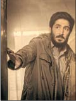
نگاهی به «تورویسم» در آیین ۲ فیلم سینمایی «هناس» و «ضد»