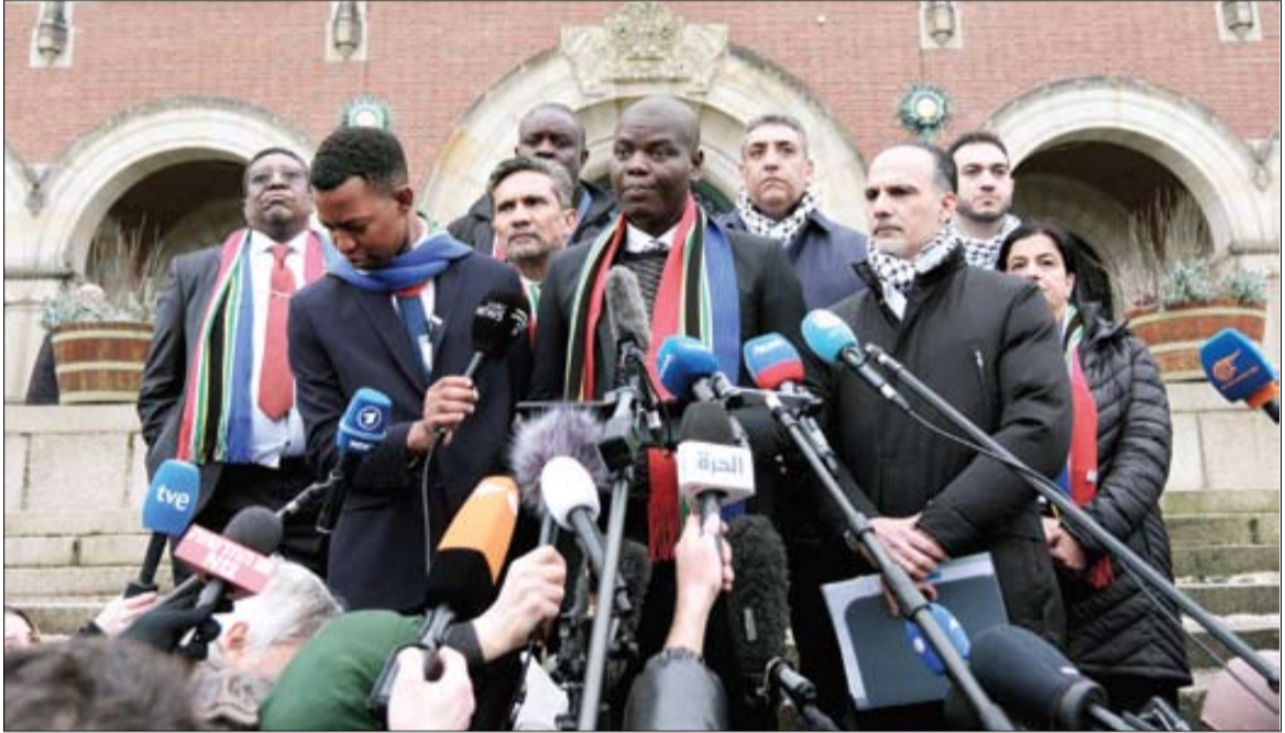
تحلیل‌های متفاوتی درباره جرایم دادگاه لاهه ارائه می‌شود. صرف‌نظر از همه آنها، این حال و روز رژیم صهیونیستی چیزی نیست که بتوان به سادگی از کنار آن گذشت

صهیونیست‌ها که با اقدام حقوقی آفریقای جنوبی در دادگاه لاهه عملاً با اتهام نسل‌کشی مواجه شده‌اند و ادله و شواهد متعدد و کلاد در کشتار فلسطینیان راهاکاری غیر از منقطه و انکار برای آنها نگذاشته، به رغم حمایت همه‌جانبه امریکا در موقعیتی قرار گرفته‌اند که بنا بر اعتراف یکی از روزنامه‌نگاران صهیونیست نه تنها شکست خورده‌اند بلکه بدترین روز از آغاز جنگ اخیر غزه را تجربه کرده‌اند | صفحه ۱۵