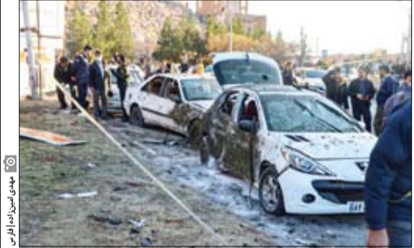
بازداشت ۳۵ نفر از پشتیبانان تروریست‌های انتحاری