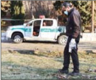
عکس‌ها فارس - مهر - اپرنا - ایسنا