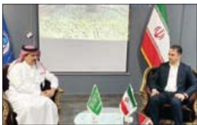
از دیدار بی‌اجازه با سفیر عربستان تا پروژه با چینی‌ها

کاش کیومرث هاشمی در لابه‌لای برنامه‌های بازدید از فدراسیون‌ها و سفرهای استانی، گپ زدن دوستانه با ورزشکاران و قهرمانان را هم می‌گنجاند تا از نزدیک پای درددل آنها بنشیند و شنونده مشکلات پرتعدادشان باشد. شاید در آن صورت به جای بیان سخنرانی‌هایی که احساسات هر کسی را برمی‌انگیزد، گره‌ای از مشکلات ورزشکاران باز می‌کرد که این بی‌تردید همانطور که خود نیز بدان اشاره دارد، مهم‌ترین کار او به عنوان وزیر ورزش است. حضور کیومرث هاشمی در ورزش ایران به امروز و دیروز محدود نمی‌شود. او سال‌های سال است که دستی بر آتش دارد و خوب می‌داند مشکل از کجاست. صحبت‌های او عین واقعیت است؛ اینکه باید تمام تمرکز ورزشکاران و مربیان روی مسائل فنی باشد دغدغه مالی نداشته باشند، اما این باید‌ها و نیاید‌ها چه زمانی باید اجرا شود.