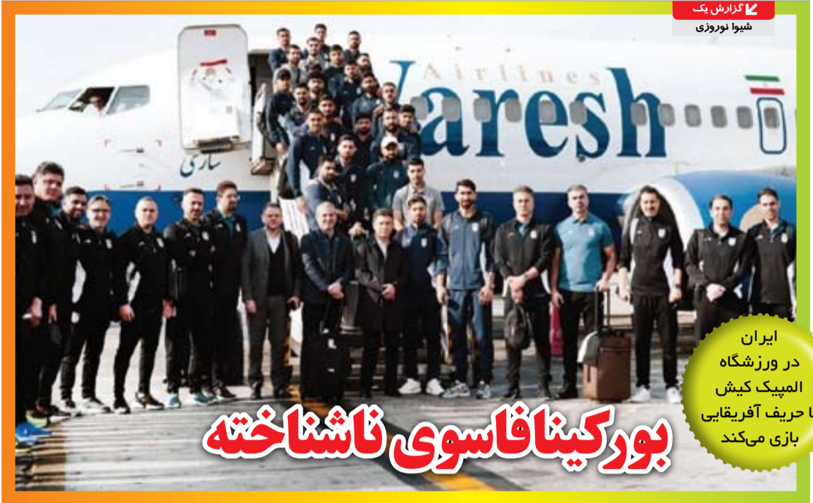
گزارش یک شبوا نوروزی

ایران در ورزشگاه المپیک کیش با حریف آفریقایی بازی می‌کند