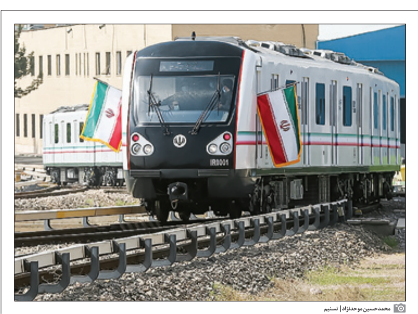
محمدحسین موذنژاد اتسینم

تاکسی به عنوان یک مدل حمل و نقل عمومی در استانداردهای حمل و نقلی محسوب نمی‌شود