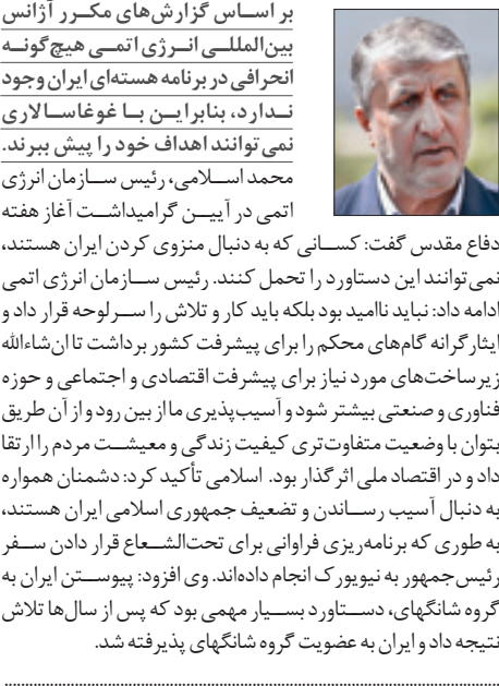
رئیس سابق خانه احزاب ایران:

دلیل دوم بر سیستمی نبودن تعیض مشروح در این متن، داشتن مثال‌های نودس بسیار است.