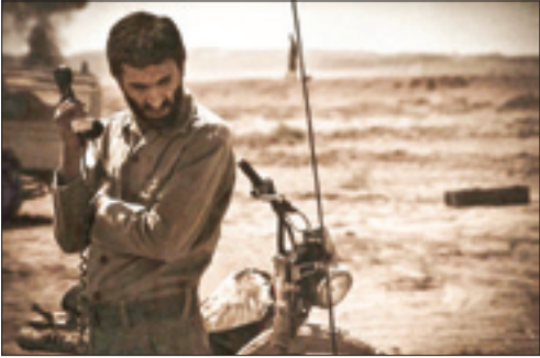
ایران از نارضایتی رسانه انگلیسی از ساخت فیلم زندگی سرداران شهید