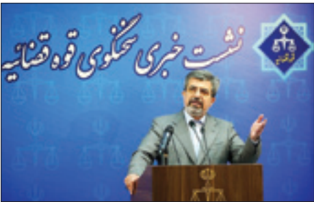
سخنگوی قوه قضائیه: