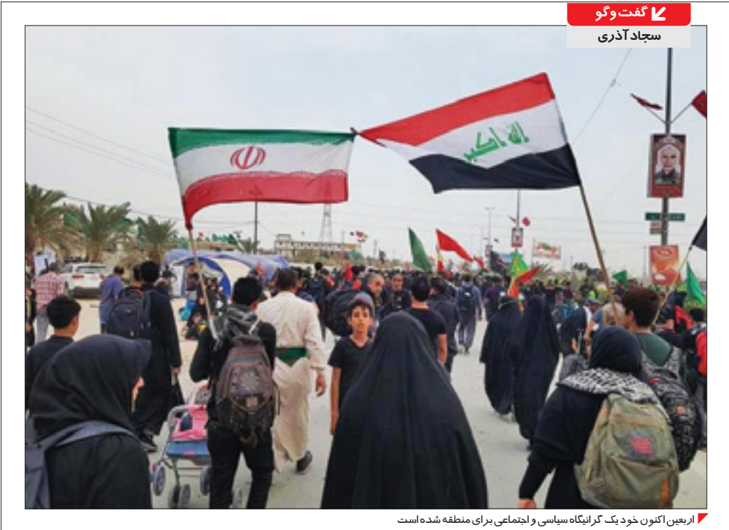
اربعین اکنون خود یک کرانهگاه سیاسی واجتماعی برای منطقه شده است