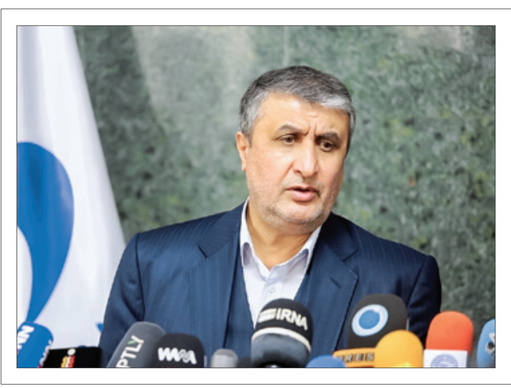
رئیس سازمان انرژی اتمی ایران، محمد اسلامی، در جریان سخنرانی خود در تهران.

۲۰ سال است به ایران درباره ساخت بمب اتمی اتهام می‌زنند و هر بار آدرس جدید می‌دهند!