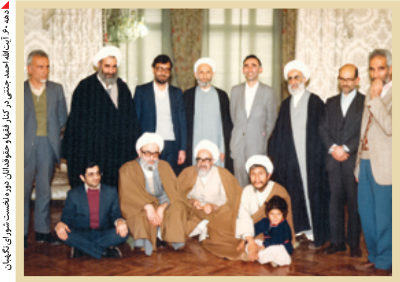
دهه ۶۰ آیت‌الله احمد جنتی در کنار فقها و حقوق‌دانان دوره نوجوانی نگهبان