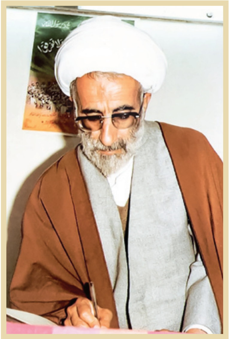
دهه ۶۰ آیت‌الله احمد جنتی

دوره نوجوانی آیت‌الله جنتی مصادف شده بود با دوران اختناق و تعدی رضاخانی‌دورانی که پدر با وجود