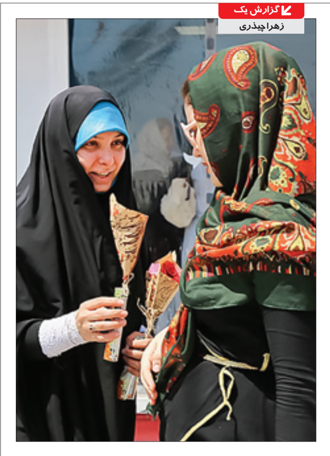
گزارش یک زهرا چیدری

گشت ارشاد که آخرین حلقه از کم‌کاری ۲۶ دستگاه در اجرای قانون حجاب است، نیازمند بازطراحی است