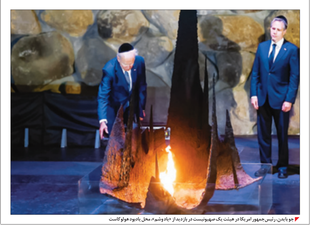
جو بایدن، رئیس‌جمهور آمریکا در هیئت یک صهیونیست در بازدید از «یاد شوم»، محل یادبود هولوکاست

بگردد با قاطعیت به آن پاسخ خواهد داد. واکنش ایران در حالی است که رژیم صهیونیستی در هفته‌های اخیر تلاش کرد اختلافی با اعراب علیه ایران تحت عنوان «پدافند هوایی خاورمیانه» تشکیل دهد تا با شوک‌ها و پهادهای ایرانی مقابله کند اما به دلیل مخالفت برخی کشورها به این طرح عملاً تحقق آن با شکست مواجه شد. با این حال اسرائیل سعی کرده با توافقات دو جانبه امنیتی با شیخ‌نشین‌های عربی خلیج فارس، تا حدی سناریوهای خود علیه تهران را اجرایی کند.