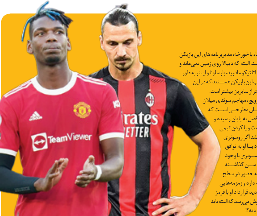
نایب رئیس باشگاه باخورخه، مدیربرنامه‌های این بازیکن داشت شخص شد. البته که دی‌بالا روی زمین نمی‌ماند و برخلاف بانوی پیر، آنتینکو مادر دی، بارسلونا و اینتر به طور جدی خواهان جذب این بازیکن هستند که در این بین گویاشانس اینتر از سایرین بیشتر است.

دنیا حیدری مذاکره با بازیکن آزاد در هیاهوی نقل و انتقالات یکی از بهترین اتفاق‌ها برای باشگاه‌هاست. خصوصاً اگر این نفرات بازیکنان مطرحی چون ابراهیموویچ، دی‌بالا، دمبله، یوگیبا و... باشند. سال گذشته و در پی مصدومیت در اردوی تیم ملی فرانسه که دوری دو ماهه از میدا بین را برای یوگیبا هافبک فرانسوی منچستر به دنبال داشت شایعه جدایی او از شیاطین سرخ سر زبان‌ها افتاد. خصوصاً که پسر طلایی فوتبال در سال ۲۰۱۳ از زمان بازگشتش به منچستر در سال ۲۰۱۶ آنطور که انتظار می‌رفت موفق نبود. با این وجود خواهان دستمزدی حدود ۵۰۰ هزار پوند بود، در خواستی که زمینه جدایی یوگیبا از اولدترافورد و بازگشتش به یوونتوس را فراهم کرد. به‌ویژه اینکه که با توجه به پایان قرارداد این هافبک مسلمان در تابستان، از ماه‌ها قبل پاری سن ژرمن و بوهه با پیشنهادی ۵۰ میلیون یورویی خواهان جذب این بازیکن بودند. فراراد فرانک کسبه ، هافبک ساحل عاجی میلان که سال ۲۰۱۷ با مبلغ ۳۳ میلیون یورو آلتانرا را به مقصد روسوتوری