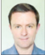
اندی هلندر گاردین

برد پر گل مقابل نیوکاسل زده شد.منتها سرمربی قرمزپوشان بادبیات خاص خوداز حق تیمش دفاع کرده‌است.پوپرگن کلوپ ادعای پی‌رارد کرده و معتقد است لیگ برتر بدون رقابت این دو تیم کسل‌کننده خواهدبود.به عقیده کلوپ، صحبت‌های پپ یک واقعیت مهم را نشان می‌دهد، تنش و فشار ناشی از جنگ قهرمانی: «فکر کنید سیتی و لیورپول تا این اندازه به هم نزدیک نبودند و برای قهرمانی نمی‌جنگیدند، آن وقت مصاحبه‌های قبل و بعد از مسابقه کسانالتی و می‌شدند. هر رقابتی حساسیت‌های خودش را دارد و واکنش پپ کاملاً طبیعی بود. همه ما فشار ناشی از حساسیت بازی‌ها حس می‌کنیم.» کلوپ معتقد است گوار دیولا نباید قبل از کنترل اعصابش مقابل دو ربین‌ها می‌نشست و صحبت می‌کرد: «قبل از اینکه به احساس تان غلبه کنید با ۲۰ دوربین مواجه می‌شوید، بلائی که سر پپ آمد حذف سیتی از لیگ قهرمانان برای آنها خیلی سخت بودو به‌عنوان مربی این شرایط را درک می‌کنم.» دو تیم بالاشین فوتبال جزیره هنوز برای تصاحب جام قهرمانی باهم در رقابت تنگناگت هستند، منتها تساوی لیورپول با تاتنهام کمی اختلاف امتیازات دو تیم را افزایش داده است. کوتاه‌نایم‌دن و ادامه دادن به این رقابت نقطه مشترک هر دو تیم است.