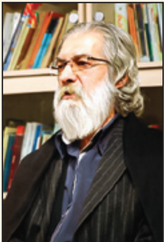
سبنا واحد مؤلف اثر «قیام گوهر شاد»

«تاریخ طرفه حکایاتی است که روایان صادق و امین آن اندکند و ناقلان پرگو و بی‌مایه آن بسیار و این خود ناشی از جهت نگرش و علت نگارش آن است، چه در قاموس کسانی، تاریخ جز شرح احوال و تحلیل وقایع می‌پردازند و تاریخ حقیقی را در رنج روزانه انبوه مردمان و تلاش تعالی جوانه انسان و صبرورث معنوی و بالندگی فکری او می‌نگرند و می‌نگارند، باری در حقیقت تاریخی که مورد قبول قرآن است و در نظر اسلام ارج و اعتبار دارد، تاریخی است که دل در دین استوار می‌سازد، در آن ذکر حق می‌شود، موجب موعظه و تذکر مؤمنان است و مایه تفکر و عبرت آموز اولوالالباب است. نظری این گونه ـ و تنها این گونه نظر- بر گذشته‌ چاره‌ساز و چراغ راه آینده مفید خواهد بود، والا فلا! اکنون به برکت برپایی نظام اسلامی، امکان بررسی واقع‌بینانه