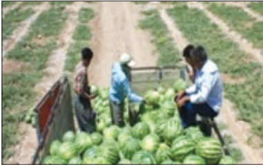
حور به ملکی