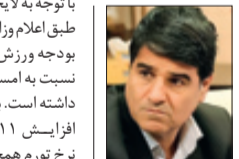
محمدابراهیم امیری سخنگوی فدراسیون کشتی