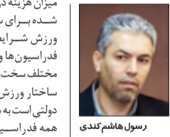
رسول هاشم کندي رئیس فدراسیون دوچرخه سواری