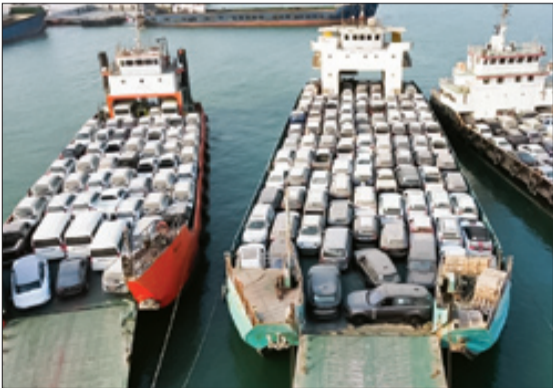
تصویر آرشیوی است

بود. اگر الان نقصی در واردات خودرو وجود دارد به دولت و وزارت صمت برمی‌گردد. نیاز انباشته امروز مردم ۴ میلیون خودرو بوده که خارج از توان خودروسازان داخلی است. به خاطر تبدیل خودرو به کالای سرمایه‌ای، ۸۰ میلیون ایرانی متقاضی خودرو هستند. راه‌حل مشکل خودرو، واردات خودرو بدون محدودیت و با تعرفه کم است.»