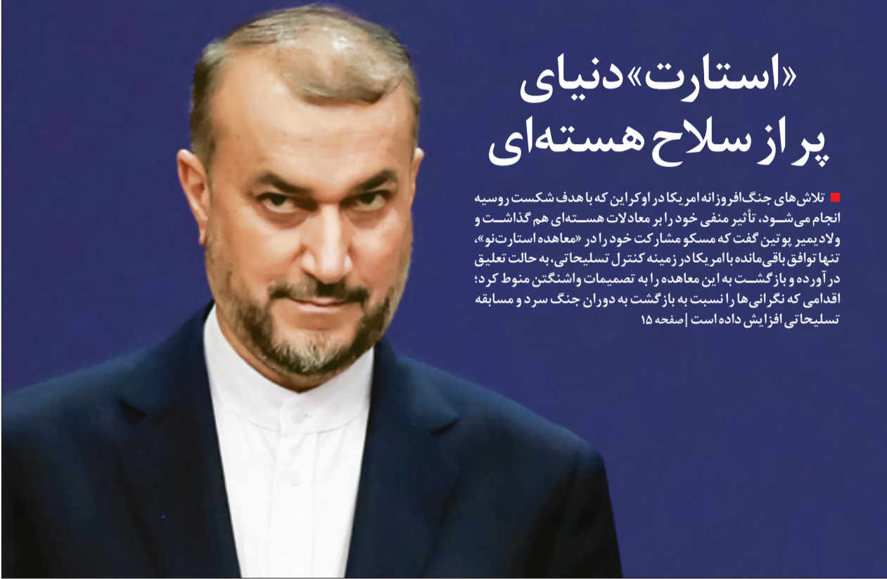
امیرعبداللّه‌یان در دیدار با مقامات عراق که می‌خواهند میزبانی ایران و امریکا باشند، اعلام آمادگی برای جمع‌بندی مذاکرات کرد اما گفت ایران نقشه دوم هم دارد

نشانه‌های بیش از هر موقع دیگری از احتمال احیای «مذاکرات احیای برجام» حکایت می‌کند، هر چند هم‌زمان، هر سناریوی جایگزین دیگری هم محتمل است. حسین امیرعبداللّه‌یان، وزیر خارجه با همین چشم‌انداز، در بغداد گفت که ایران آماده است بر مبنای مذاکرات قبلی و با رعایت خطوط قرمز در مسیر جمع‌بندی نهایی مذاکرات انجام شده در وین قدم بردارد و هم‌زمان هشدار داد اگر طرف امریکایی مسیر دیگری انتخاب کند، ما هم آماده عملیاتی کردن پلن ۲ و مسیر دیگری هستیم | صفحه ۱۵