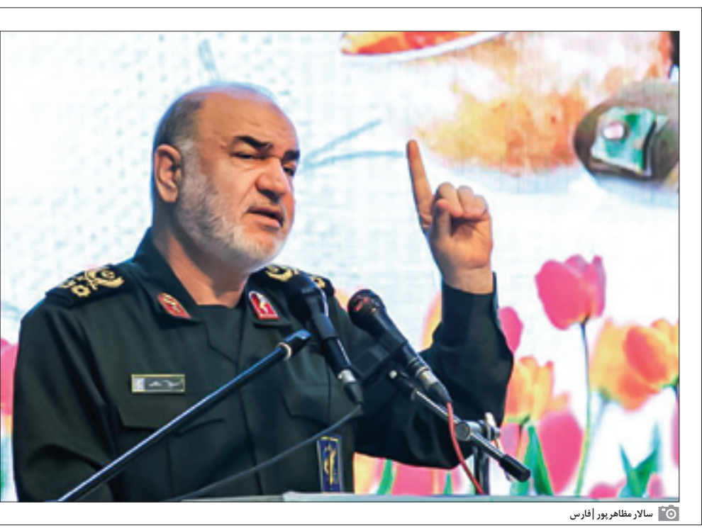
سار مظاهر بی‌افرس