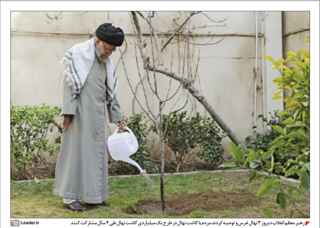
رهبر معظم انقلاب دیروز ۲۲ نهال غرس و توصیه کردند مردم با کاشت نهال در طرح یک میلیاردی کاشت نهال طی ۴ سال مشارکت کنند

و تأکید کردند: هیچ کس نباید این قانون را نقض کند.