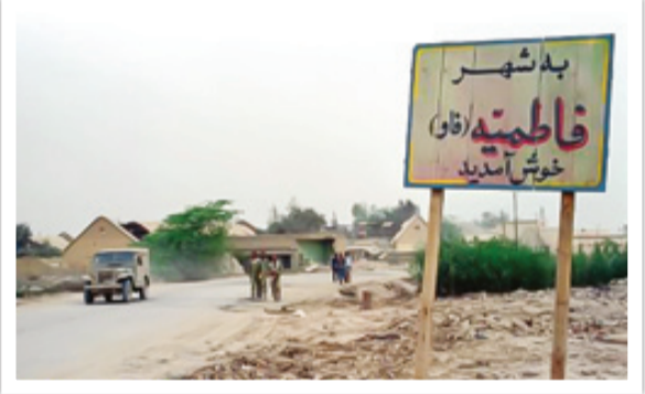
سب از تصرف فاو نام فاطمیه روی آن گذاشته شده بود

بودا باید با قرار دادن اژدر، این سد محکم و آهنی در ساعت مقرر منفجر و با عبور از آن سرپل از دشمن گرفته می شد. سپس راه برای آمدن قایق‌ها هموار می شد. لحظه موعود و سرنوشت‌ساز فرا رسید و درگیری نیروهای شجاع غواص با رمز یا فاطمه الزهرا(س) رأس ساعت ۲۲:۱۰ آغاز شد. دشمن تصور نمی کرد نیروهای رزمنده ایرانی بتوانند از این رودخانه وحشی و پر تلاطم عبور کنند و موانع را پشت سر بگذارند، اما اعتقاد بچه‌ها به خدا همه این نامحتمل‌ها و سختی‌ها را برای عبور نیروهای سپاه