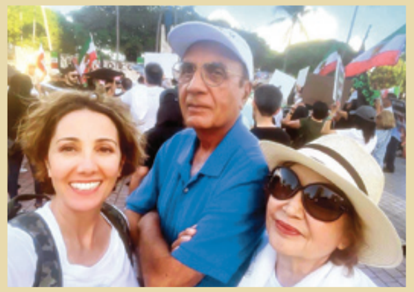
در کنار همسر و دخترش در یکی از تجمعات صافلالامون در امریکا