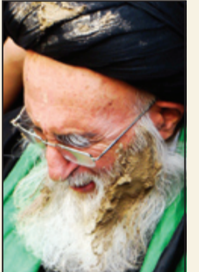
آیت‌الله سیدمهدی امامی سدهی در روز عاشورای حسینی

«به مناسبت فرارسیدن اربعین از تحال ملکوتی عالم ربانی، فقیه صمدانی، زاهد پرهیزگار، بزرگ احیاگر شعائر مقدسه فاطمی و حسینی(ع)، جد حقیر مرحوم آیت‌الله حاج سیدمهدی امامی سدهی (قدس سره)، بر آن شدم که رساله‌ای مختصر از ایشان و خاندان معظم‌شان را در حد بضاعت خویش تقدیم کنم. از آنجا که مرحوم جد علاقه‌ای خاص نسبت به حقیر داشته و این علاقه متقابل بوده، لذا تنها انگیزه‌ام در مبادرت به این امر، پاسداشت همین ارتباط معنوی است. یکی از مهم‌ترین مسائلی که در زندگی حقیر اتفاق افتاد و از این جهت، خویش را مدیون عنایات مرحوم جد می‌دانم، این است که در سال ۱۳۸۷ ه. ش. و طبق سنوات گذشته، در ایام دهه‌عاشورای مولای دو سراسر حضرت سیدالشهدا(ع) و همچنین در ایام سوگواری ولی‌عالم امکان حضرت فاطمه‌زهر(ا.س)، در بیت معظم‌له، مجالس عزاداری متعقد می‌گردید. ایشان