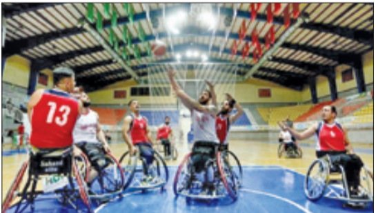
کچدار و مرز بسکتبال با ویلچر با مشکلات اقتصادی