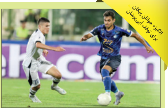
انگیزه جوانان پیکان برای توقف آبی‌پوشان

در این اوضاع مدیرعامل فعلی همچنان در اندیشه ترکدن بمب و گرفتن بازیکن خارجی است. البته خودش می‌گوید بیشتر وقتش را برای پیدا کردن منابع مالی و تأمین هزینه‌های باشگاه صرف می‌کند، منتها این ابهام برای هواداران آبی وجود دارد که باشگاه به‌دکاری چون استقلال با داشتن