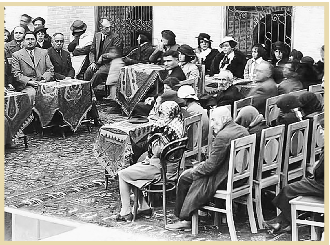
تصانی از یکی از مراسم‌های جشن حجاب که در آن برخی از زنان چپوه خویشان را پوشانده‌اند

بی‌تردید نماد آرمانی حکومت پهلوی در حوزه زنان، زن مدرن و متجدد و دریافت آموزش و ورود به عرصه‌های مختلف اجتماع، منوط به کشف حجاب شده بود. (۵) همین امر موجب واکنش علما و روحانیون به اصلاحات سال‌هایی که حکومت پهلوی اول در آن سر، در قالب تشکیلات زنانه به ترویج مدل زن اروپایی می‌پرداختند، زنان در غرب همچنان در وضعیت پلاتکلیفی به سر می‌برند. سال‌ها بعد از آن، جنبش فمینیستی اروپا که به تغییر الگوی خانواده و ازدواج در آن سرزمین منجر می‌شد، هنوز در ابتدای مسیر خود قرار داشت، با این حال چنین پدیده‌ای در دوره پهلوی دوم، به نحوی ترویج می‌شد که گویا تنها نسخه سعادت زنان در مسیر رشد فرهنگی و اقتصادی است