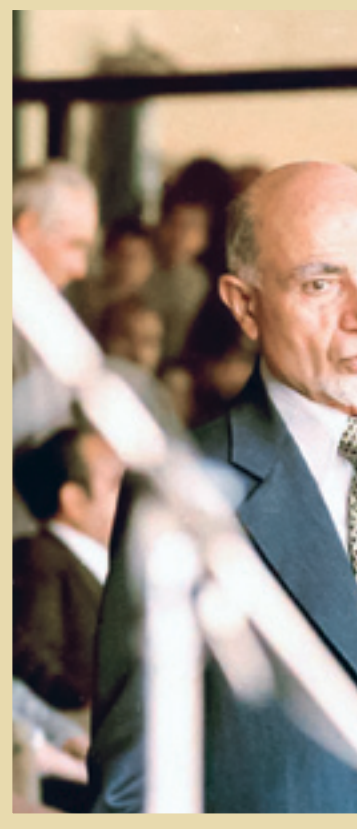
فروردین ۱۳۵۸، محمد توسلی در کنار مهدی بازرگان

کنکاش و بررسی اسناد لانه جاسوسی در زمینه ارت تباط گیری و جذب عناصر غربگرا و از جمله اعضای نهضت آزادی ایران، به خوبی این نکته را نشان می‌دهد که این افراد به دلیل گراییش و شیفتگی که به فرهنگ و اندیشه غربی داشته‌اند، به راحتی به امریکایی‌ها که دشمنی دیربسه‌ای با ایران و ایرانی داشته‌اند، اعتماد کرده و دقیقا به همین علت در برهه‌های بعدی، در یازل دشمن برای ضربه زدن به منافع نظام جمهوری اسلامی نقش آفرینی کرده‌اند