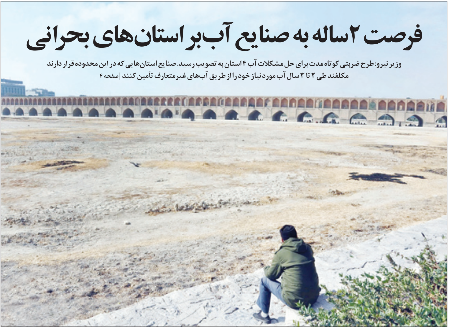
زمر بلخانیان اپوزا

وزیر نیرو: طرح ضربتی کوتاه مدت برای حل مشکلات آب ۴ استان به تصویب رسید. صنایع استان‌هایی که در این محدوده قرار دارند مکلفند طی ۲ تا ۳ سال آب مورد نیاز خود را از طریق آب‌های غیرمتعارف تأمین کنند | صفحه ۴