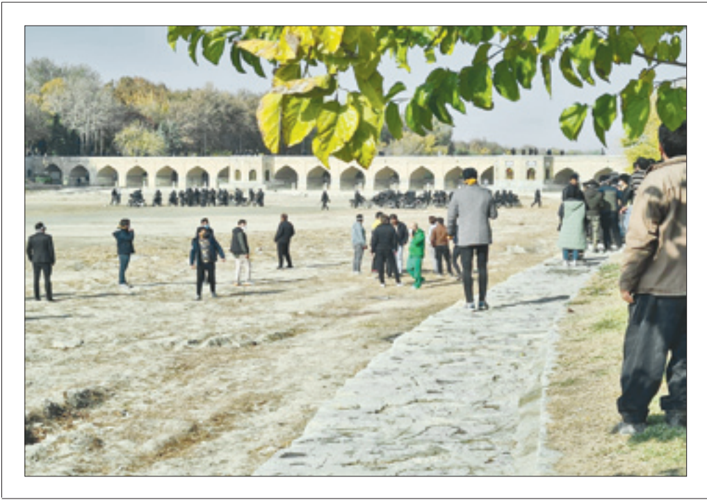
موج سواری در بستر خشک زاینده‌رود

طی دو هفته گذشته دو مجموعه متفاوت در اصفهان را شاهد بودیم؛ جمعه نخست بیان مشکلات به شکلی مسالمت‌آمیز بود و جمعه دیگر اقدامات خشونت‌آمیزی بود که صرفاً تصفیه‌حساب‌های جماعتی است که با اصل انقلاب مشکل دارند و تلاش می‌کنند مطالبات مردمی را سمت و سوی سیاسی و حزبی بدهند. جمعه ۲۸ آبان ماه صدها نفر از مردم این شهر در اعتراض به کم‌آبی در کنار سی‌وسه کیلومتر راه به کف خیابان‌ها آن هم نه به صورت مسالمت‌آمیز بلکه با هدف درگیری با نیروهای انتظامی داشته‌اند.