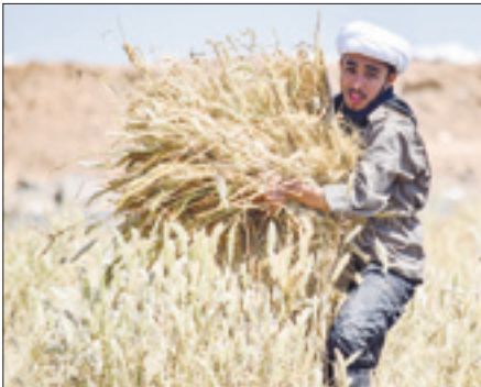
جهادگران و خدمت به کشاورزان برای برداشت محصول