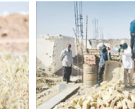
ساخت خانه‌ها در روستاها