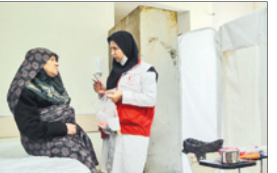
رسیدگی به وضعیت سلامت سالمندان در روستاها