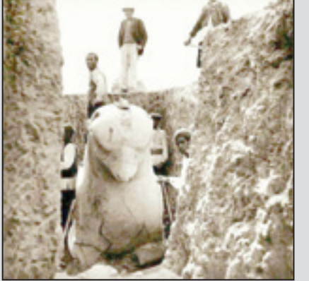
نقطه کشف شیردال هخامنشی در سال ۱۲۱۰ طی کاوش‌های باستان‌شناسی تخت جمشید اصفحهٔ توثیقی آسمان رستمی‌بور