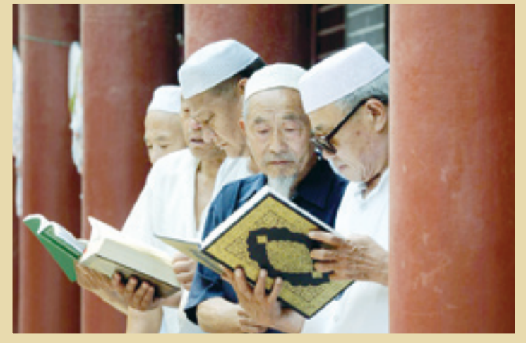
مسلمانان چینی در حال نماز در تهران.