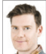
بل مکینزد گاردین

سرود ملی ژاپن و گروهی از نوازندگان که سایر وسایل هواپیمارا شبیه‌سازی می‌کردند به رژه ملت‌ها رسیدیم. تیم پناهندگان که به نمایندگی از معلولانی بودند که مجبور به ترک خانه‌های خود در سراسر جهان شده بودند، ابتدا وارد میدان شدند. کمی بعد نماینده افغانستان آمد؛ تنها یک داوطلب ژاپنی که پرچم را حمل می‌کرد، پس از آنکه دو ورزشکاری که قرار بود برای کشور خود رقابت کنند، به دلیل آشفتگی سیاسی فعلی نتوانستند خانه خود را ترک کنند. اگر همه اینها یادآور بسیار واضح از واقعیت‌های جهان خاص از حباب توکیو ۲۰۲۰ به نظر برسد، احساس در ورزشگاه المپیک چیزی جز نگرانی نبود. در مراسم رژه نمایش قدرت چینی‌ها را شاهد بودیم که بزرگ‌ترین کاروان را داشتند تا رژه کاروان‌های کوچک مانند جمهوری دموکراتیک کنگو، فلسطین و زیمبابوه. در مورد لباس‌ها از کلاه‌های تاجیچی تا لباس‌های مالزی از ایریشم آبی شکوفا یا ماسک‌های متناسب، شور و شوق و احساس شعله‌ور بود. مراسم افتتاحیه حس‌ی را هدایت می‌کرد که وقتی باورزشکاران پارالمپیک صحبت می‌کنید ملموس است که آنها (فقط) داستان‌های شجاعانه و الهام‌بخش نیستند، بلکه افرادی پویا و قاطعند که به دلیل شرایطی که با آن روبه‌رو هستند، از توانایی‌های خود اطمینان بیشتری دارند. در افتتاحیه پاراسونز، رئیس کمیته بین‌المللی پارالمپیک خواستار «فرصت برای همه» در جهان پس از همه‌گیری شد و استدلال خود را در یک شعار ساده خلاصه کرد و گفت: «تفاوت یک نقطه قوت است، نه یک نقطه ضعف.»