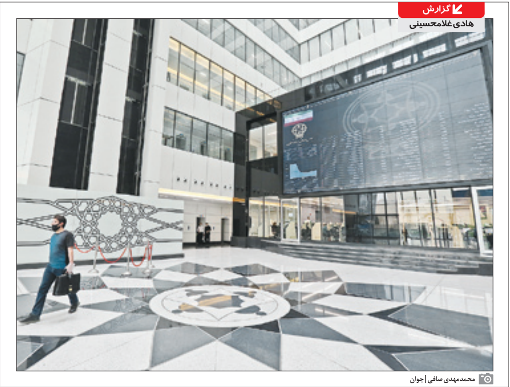
گزارش هادی غلامحسینی

انتصاب رئیس سازمان بورس در چارچوب قانون انجام نشده است