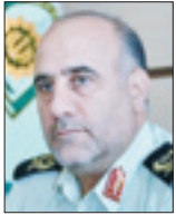
سردار حسین رحیمی

دکتر شیری معتقد است: «در خودنمایی در ذات یک دختر یا پسر نوجوان هست و بنابراین نمی‌توان فقط هلیا را مقصر دانست. او محصول شرایط ایجاد شده‌است. در سن رشد این گرایش خودنمایی وجود دارد حال گاهی در درگیری و گاهی در کلاس درس طبیعتاً برای خاندانی می‌خواهد در شرایط جامعه ما جذاب‌تر باشد به این گونه بروز می‌کند. می‌گویند نگرانیم. مشکل ما همین است که نگرانیم ولی کاری انجام نمی‌شود. مشکل دیگر اینکه نگرانیم هلیا الگوی دختران دیگر شود. این نگرانی در زمان‌های قبل نیز مطرح شد، ولی ما فرصت‌های طلایی را به دلیل بعضی بی‌تدبیری‌های ذات دست دادیم. اتفاقات در حوزه فرهنگ را باید مثل کوبیخ شناور دید. ما قسمت جزئی آن را می‌بینیم ولی قسمت اعظم آن زیر آب است و دیده نمی‌شود. نزاع خیابانی بین دختران سال‌هاستی دیده می‌شود ولی کلاس نشین را تا حالا ندیده بودیم. زمانیکه وارد اجتماع می‌شویم سعی می‌کنیم رفتارمان را کنترل کنیم اگر به جایی برسد که این کنترل انجام نشود همه چیز غیر قابل کنترل می‌شود و بدلیتم اتفاقات دیگری هم خواهد افتاد. شخصیت اجتماعی اگر غالب شود این مخاطرات را خواهد داشت. امروز هلیا را فراد دیگری را خواهیم دید.»