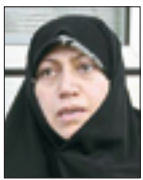
فاطمه محمدی رئیس فراکسیون جمعیت مجلس شورای اسلامی

حالا که با مشارکت فعال زنان به عنوان نیمه فعال بدنه اجتماعی کشور انتخابات برگزار شد، زنان جامعه هم از رئیس‌جمهور منتخب خود انتظارات و مطالباتی دارند. زنان از رئیس‌جمهور سیزدهم خود انتظار دارند توجه جدی و اهمیت موضوع زن و خانواده را در سیاستگذاری و برنامه‌های خود داشته باشند. کشور ما در موضوع زن و خانواده با سیاست‌ها و آنچه طبق نگاه امامین انقلاب مطرح است از منظر ایده‌آل‌ها و مطلوبات فاصله زیادی دارد. رهبر معظم انقلاب هم در سخنرانی‌های خود فرمودند که در حوزه زنان و خانواده کارهای زیادی انجام شده است اما تا تحقق دیدگاه‌های اسلام و انقلاب فاصله بسیار زیاد است. بنابراین یکی از انتظارات جامعه زنان ما این است که دولت‌مداران ما رویکرد صحیح‌تری نسبت به مسائل حوزه زن و خانواده داشته باشند و نگاه خودشان را به نگاه امامین انقلاب نزدیک‌تر کنند. از طرفی موضوع خانواده یکی از موضوعات اساسی و راهبردی کشور محسوب می‌شود. از موضوعات اساسی و مهم دیگر در این حوزه اشتغال و معیشت زنان سرپرست خانوار و همینطور بیمه زنان خانه‌دار و زنان سرپرست خانوار است و حمایتی که دولت آینده از زنان فعال عرصه‌های اقتصادی و