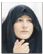
مینا بیانیانی رئیس سازمان بسیج جامعه زنان

زنان به عنوان عضو مؤثر در خانواده و تلاش برای استحکام آن اصلی‌ترین نقش را ایفا می‌کنند. آنها با وجود امورات سنگین خانه و زندگی هیچ‌گونه نتایج‌ای نشده بلکه تعمیق نیز شده است. زنان به عنوان عضو مؤثر در خانواده و تلاش برای استحکام آن اصلی‌ترین نقش را ایفا می‌کنند. آنها با وجود امورات سنگین خانه و زندگی هیچ‌گونه نتایج‌ای نشده بلکه تعمیق نیز شده است. زنان به عنوان عضو مؤثر در خانواده و تلاش برای استحکام آن اصلی‌ترین نقش را ایفا می‌کنند. آنها با وجود امورات سنگین خانه و زندگی هیچ‌گونه نتایج‌ای نشده بلکه تعمیق نیز شده است. زنان به عنوان عضو مؤثر در خانواده و تلاش برای استحکام آن اصلی‌ترین نقش را ایفا می‌کنند. آنها با وجود امورات سنگین خانه و زندگی هیچ‌گونه نتایج‌ای نشده بلکه تعمیق نیز شده است.