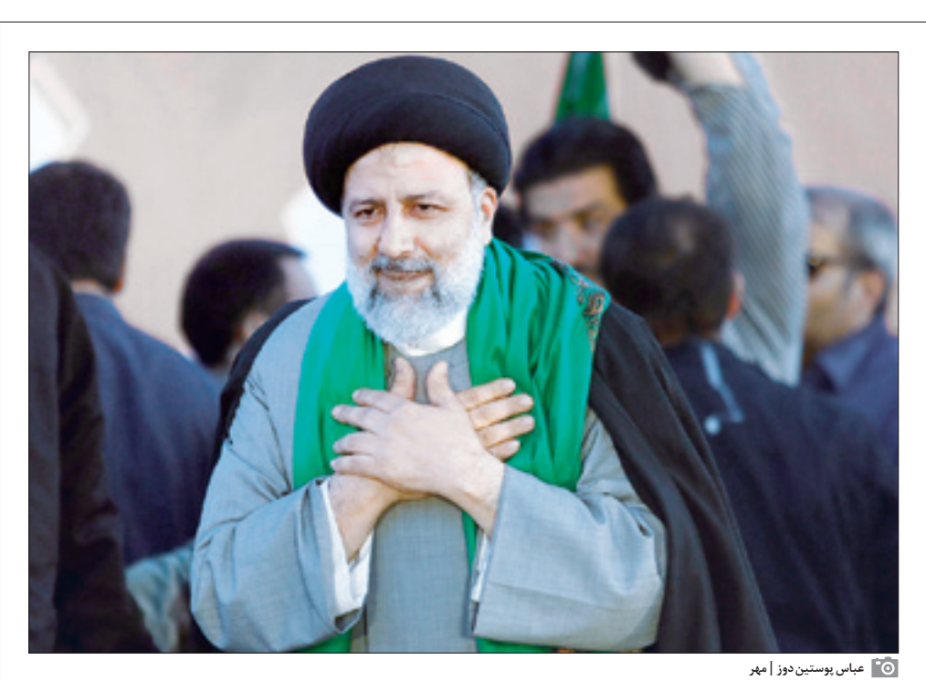
عباس یوسئین دوز امیر

دولت سیزدهم اولویت اصلی خود را بعد از پیروزی در انتخابات تقویت معیشت مردم اعلام کرده است. این اولویت‌بندی مورد تأیید مقام معظم رهبری نیز قرار دارد اما با نگاهی به شرایط فعلی کشور می‌توان گفت دولت سیزدهم با چالش‌های سنگینی در این مسیر روبه‌رو است که نه فقط بحث‌های اقتصادی بلکه حوزه‌های فرهنگی و سیاست خارجی را نیز در بر می‌گیرد، با این حال امید است دولت سیزدهم بتواند با دوری از حواشی و الگویی برای حل این بحران‌ها تبدیل شود. دولت سیزدهم تقریباً از ۲۸ روز دیگر کار خود را آغاز خواهد کرد و از هم اکنون کم و بیش تا حدود زیادی روشن و مشخص است. نگاهی به شرایط فعلی به خصوص اولویت‌هایی که توسط مقام معظم رهبری در دیدار با نمایندگان مجلس مطرح شد ذیل مباحث اقتصاد و معیشت مردم است. ماجرای بیکاری نکته دیگری است که در صحنه اجرایی مطرح شد و ایشان بر حل آن اصرار داشتند، از این رو می‌توان گفت تمام این درخواست‌ها در ذیل مباحث اقتصاد و معیشت مردم توجیه به بهتر شدن وضعیت اقتصادی کشور قابل تحلیل است. مسئالت دیگری همچون جایگاه ایران در شرایط اقتصادی پس از همه‌گیری کرونا با نحوه تعامل با همسایگان نیز از جمله نکاتی است که باز هم ذیل مسئله اقتصاد قابل طرح است اما در این میان اگر بخواهیم با عنین واقع‌بینی به چالش‌های اقتصادی دولت سیزدهم به خصوص در ماه‌های ابتدای آن نگاه کنیم، چه مشکلات و موانعی بر سر راه آن وجود دارد و در مقابل فرصت‌های فعلی چه خواهد بود؟