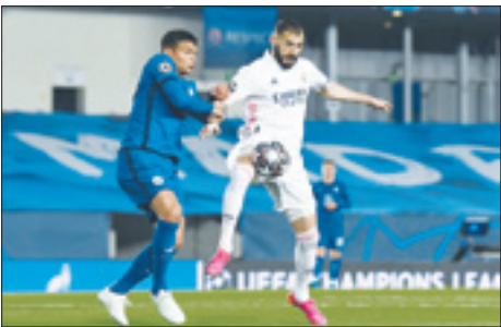
چلسی، رئال را زمین گیر کرد