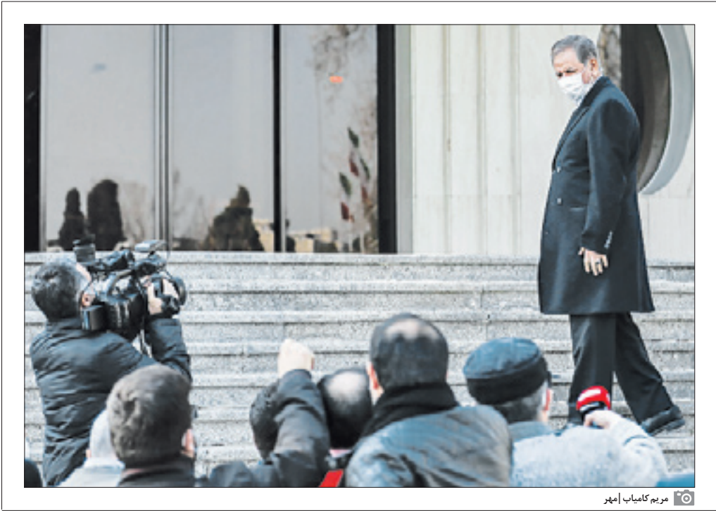
مریم کامیاب امهر

اسحاق جهانگیری جمعه‌شب طی گفت‌وگویی در کلاب‌هاوس پاسخگوی سؤالاتی پیرامون هشت سال حضورش در مقام معاون اول رئیس‌جمهور در دو دولت حسن روحانی بود. افرادی منتخب سؤال می‌پرسیدند و جهانگیری پاسخ می‌داد. سؤال اول: جهانگیری نشست خبری و بدون امکان نقد و نظر و بررسی و راستی‌آزمایی سخنان او، جهانگیری بر محور یک دوقطبی متناقض حرف‌ها می‌زد: «در دولت و آن عبارت درصحنه که «اختیار تغییر منشی‌ام را هم ندارم» واضح می‌آید و از سویی دیگر از «مسئولیت‌های مختلف» و از سویی دیگر از «مسئولیت‌های مختلف» خود در دولت و اقدامات و دستاوردهایش می‌گوید. جهانگیری می‌گوید حکم‌ها در دفتر رئیس‌جمهور زده می‌شد و بعداً مطلع می‌شد.