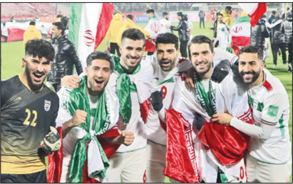
صعود ایران به جام جهانی

از چهارم آذر ۱۳۵۶ تا هفتم بهمن ۱۴۰۰، از روزی که با برتری مقابل استرالیا اولین صعود ایران به جام جهانی را جشن گرفتیم تا روزی که سوت پایان کریستوفر جیمز بیث استرالیایی، پای ششمین صعود به جام جهانی را با برد یک بر صفر مقابل عراق امضا کرد، حالا ایران پاییز آینده یکی از ۲۲ تیم حاضر در قطر خواهد بود، آن هم در حالی که سه هفته تا پایان رقابت‌های مرحله نهایی گروهی باقی مانده است. برد مقابل عراق در هفته دوم دور برگشت، امتیازهای ایران را به عدد ۱۹ رساند تا بازی‌های باقیمانده تشریفاتی شود و با خیال راحت و بدون استرس اسکوچ و ملی پوشان در ادامه بازی‌ها، نقشه‌های موفقیت در جام جهانی سال آینده را برای خودشان مرور کنند. چهره‌های ویژه بازی پنجشنبه در استادیوم آزادی تهران را مرور کرده‌ایم.