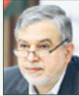
رضاصالحیامیری رئیس کمیته‌ملی المپیک

در دهه‌های بعد از پیروزی انقلاب اسلامی، زنان ایران در بخش‌های مختلف رشد چشمگیری داشتند و حتی در بخش علمی جلوتر از مردان بودند. در ورزش نیز ما شاهد شکوفایی استعداد زنان بودیم، در رشته‌های رزمی زنان ایران حتی از مردان پیشی گرفتند و دختران ایرانی در رشته‌هایی مانند والیبال، بسکتبال ووزنه‌برداری