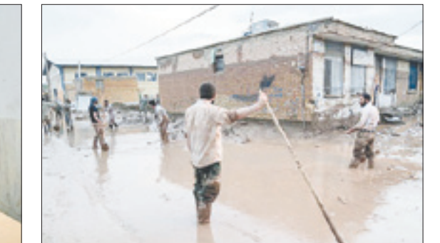
جهادگران، سبیل‌زدگان را تنها نگذاشتند

در زمینه مقابله با ویروس کرونا تاکنون ۶ هزار و ۲۰۰ گروه جهادی در قالب ۶۰ هزار بسپجی پای کار همدلی با مردم و کادر درمانی بودند و همچنان این کار ادامه دارد. طی چند هفته گذشته ۱۰۰ طرح بسپج سازندگی سیاه نییوای گلستان به صورت متمرکز در کوی اوزینه سرگران افتتاح شد. مسکن محرومین، جاده‌های بین مزارع، کانال‌های بتنی و احیا قنوت با ۱۰ میلیارد تومان اعتبار از جمله طرح‌های افتتاحی بود. همچنین ۳۰ هزار بسته معیشتی به ارزش ۱۵ میلیارد تومان بین محرومین استان توزیع شده است. در پنج سال گذشته سیاه نییوای گلستان ۲ هزار و ۲۵۰ واحد مسکونی، طرح‌های آبرسانی آب شرب و آب کشاورزی، مدرسه، غسالخانه و خانه عالم با اعتبار ۱۰۵ میلیارد تومان و مشارکت خیران ساخته و به مردم تقدیم کرده است. در بخش اقتصاد مقاومتی، پس از فرمان رهبر معظم انقلاب، بیش از ۵ هزار و ۸۰۰ واحد اقتصاد مقاومتی و صنایع تبدیلی با ۸ هزار نفر اشتغالزایی در سراسر استان رانندگی شده که برای این واحدها ۱۲۰ میلیارد تومان تسهیلات قرض‌الحسنه و عقود اسلامی در اختیار بسپجیان و عموم مردم قرار گرفته است. فعالیت در عرصه‌های کشاورزی و منابع طبیعی، اقتصاد مقاومتی و صنایع تبدیلی، خدمات‌رسانی شامل معیشتی، جهیزیه، بهداشت و درمان، آموزش و فنی حرفه‌ای، کمک به مردم در بحران‌های طبیعی از جمله مواردی است که بسپج سازندگی ورود کرده است.