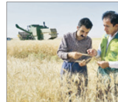
مهندسان کشاورزی بسپجی به فیلان این عرصه مشاوره می‌دهند

یکی از برنامه‌های بسپج سازندگی رانندگی اردوهای جهادی تخصصی و محله‌محور است که از سال گذشته با هماهنگی سازمان آموزش فنی و حرفه‌ای در نقاط مختلف با توجه به نیازمندی‌ها رانندگی در اختیار اجرائی ۳۵۲ باب سرویس بهداشتی و حمام منازل محرومین با اعتباری بالغ بر ۳۵ میلیارد ریال در ۱۲۰ روستای شهرستان در میان آغاز شده است. حضور جهادگران تخصصی در روستاها کمک مؤثری در راستای حل مشکلات روستاییان دارد که در خراسان جنوبی این طرح روز به روز در حال توسعه است. براساس تفاهنامه منعقد شده با بنیاد علوی اقدامات خوبی در راستای محرومیت‌زدایی روستاهای در میان با همکاری گروه‌های جهادی انجام شده است. امیدواریم با تلاش گروه‌های جهادی، ظرفیت بومی و گروه‌های بسپج محله‌محور این پروژه‌ها با کاهش هزینه و کوتاه‌ترین زمان ممکن به اتمام برسد. از سال گذشته گروه‌های جهادی تخصصی در نقاط مختلف براساس نیازمندی‌ها فعالیت آموزشی خود را آغاز کرده‌اند و به مناسبت سالگرد شهادت حاج قاسم سلیمانی برگزاری اردوهای جهادی تخصصی اصناف و مهارتی در هشت شهرستان برنامه‌ریزی و همچنان ادامه دارد. در این اردوهای جهادی تخصصی ۹۵ نفر جهادگر که در زمینه‌های مختلف تخصص دارند در روستاها خدمات آموزشی مهارتی ارائه می‌دهند.