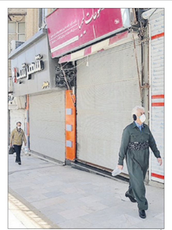
کیوان فیروززه ای استیم

معاون وزیر کشور: در صورت ورود افراد غیر بومی به شهرهای با وضع نارنجی یا قرمز هر ۲۴ ساعت به ترتیب ۵۰۰ هزار و یک میلیون تومان جریمه می‌شوند