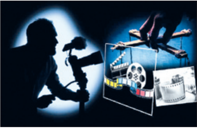
مجله‌های غربی، در جشنواره فیلم‌های ایران، جایزه‌بگیران را به رسمیت می‌شناسند.

آیا این بهانه که یک فیلمساز یا بازیگر در جشنواره خارجی برگزیده شده بدون توجه به محتوای مجعول و سیاه‌نماییه آن فیلم می‌تواند دلیلی برای سکه‌پاشی به پای آنها باشد