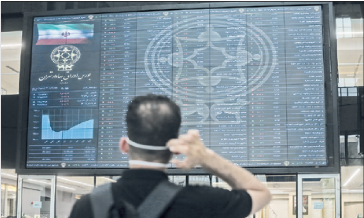
مصدعی سالی جوان