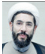
سرهنگ پاسدار مصطفی رستمی رئیس نهاد نمایندگی مقام معظم رهبری در دانشگاه‌ها